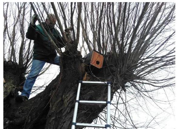
De steenuilenkast wordt geplaatst

De kracht van de natuur schuilt voor groot deel in de veelheid aan diersoorten die in het gebied leven. Zij verrichten veel wat in politiek jargon ‘ecosysteemdiensten’ heet. Anders gezegd: ze zorgen voor een stabiel ecosysteem waarin evenwicht kan heersen en een natuurlijke kringloop heerst.