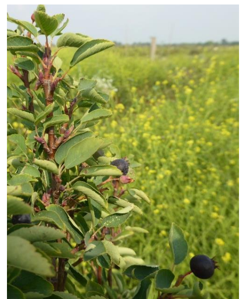
Krentenboom Prince Charles in de mosterd. Met natuurlijk een kroontje op de besjes. ( zie bes rechtsonder)

Twee wilde eenden broedden op het terrein en zeker een van de nesten moet verantwoordelijk zijn voor de 8 jonge eendjes die in de aanpalende watergang zwommen op een gegeven moment. Een ril van gesnoeiende wilgentakken is aangelegd door een knotter van de SOGN bij de pecans, achter de wal. Later, met nieuwe aanvoer van takken kan deze nog uitgebreid worden.