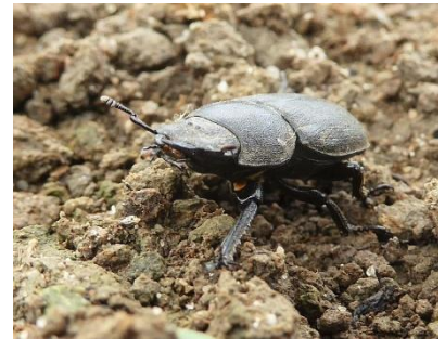
Het Klein vliegend hert

Om een vinger aan de pols te houden is monitoring nodig. Daarmee wordt op termijn duidelijk hoe natuur en landbouw zich samen ontwikkelen. De spontane vegetatie van vaatplanten monitort de beheergroep zelf en ook worden aantekeningen gemaakt van overige waarnemingen, zoals het klein vliegend hert, een best bijzondere kever die hier rondliep. Aan een uitgebreider en systematischer monitorproject met de andere gaarden in De Park wordt in 2018 begonnen.