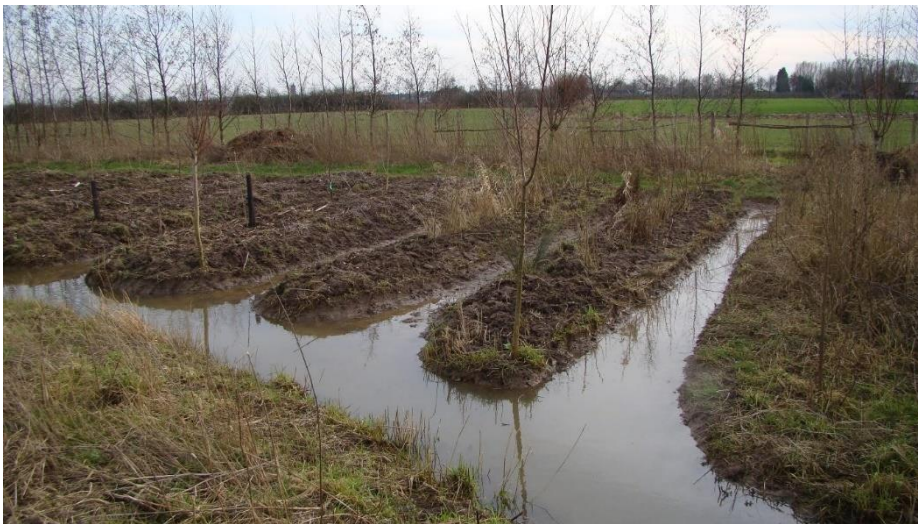
Rabatten, vers opgeworpen in februari.

In de natte zuidwesthoek van De Parkse Gaard waar elke begroeiing heel slecht aansloeg, is vorig jaar is geëxperimenteerd met verschillende manieren van grondverbetering. Op vijf afgemeten perceeltjes werden eigen compost, gekochte compost, groenbemesters of schapenmest gebruikt plus een controle vak. Alleen de mest werd ondergespit. De aanplant in najaar 2021 heeft het in 2022 goed volgehouden. Verschillen tussen de wijze van bodemverbetering waren niet goed aan te wijzen, ook niet waar de meest ingrijpende methode, dikke laag schapenmest gecombineerd met twee spaden diep spitten, toegepast was. Dat twee van de veldjes begin 2022 zijn vergraven tot rabatten, haalt de uitkomst van de proef deels onderuit. Het water stond er tot net onder het maaiveld, erg nadelig voor de nieuwe aanplant. Ook van de ernaast gelegen rozenbottels en gele bessen zijn geulen gegraven om ze droger te zetten. Slechts enkele planten van de vlier, hazelaar, zwarte bes en framboos zijn verdwenen in het eerste jaar.