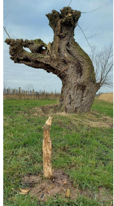
Dit wilgje was natuurlijk bedoeld om de oude wilg te gaan vervangen.

Uit de monitoring van de voedselbossen bleek dat de vegetatie verschuift van veel ruigtesoorten naar meer grassen. Met name distels en zuring nemen af. De vlinders hadden wat aantal individuen betreft en in aantal soorten een goed jaar. In andere voedselbossen kan dit anders liggen, het is erg afhankelijk van de omstandigheden per jaar. Aan paddenstoelen is de waarneming nog beperkt, mycorrhizasoorten zijn nog niet gezien. Ook voor mossen is de ontwikkeling nog pril. Kikker en kleine watersalamander zijn er wel volop, Vlinders, kikkers en salamanders, vogels vertonen in wisselende mate een voornamelijk opgaande lijn in aantallen en of soorten.