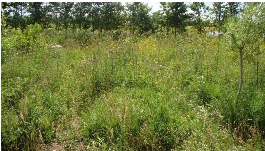
Rabatten in juni.