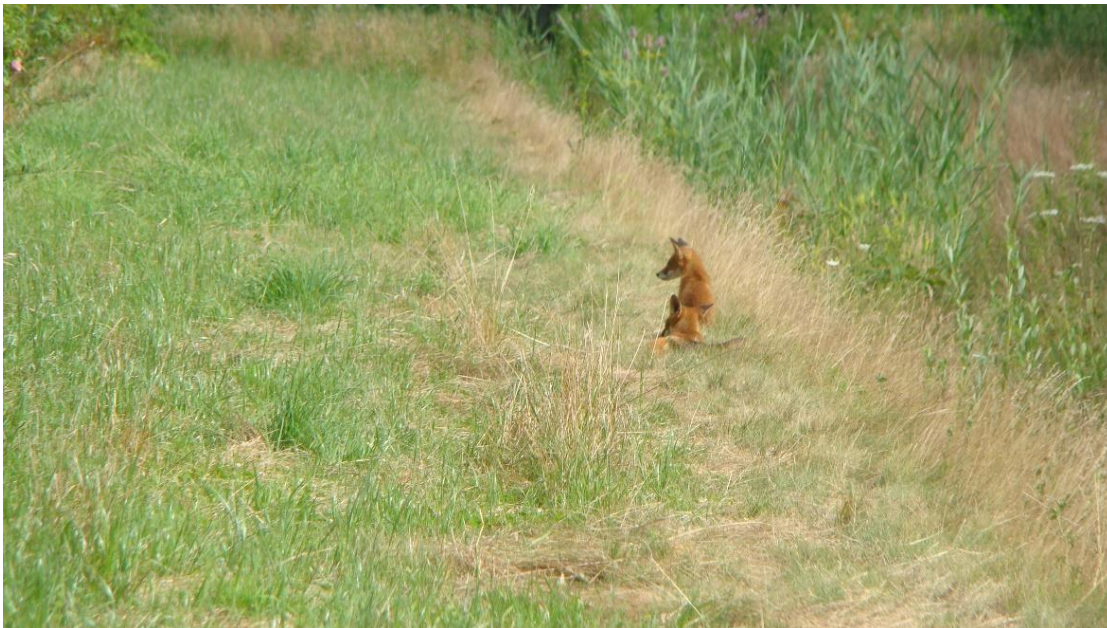
Twee van de drie jonge vosjes op het werkp pad naast de Santackergaard.

Een vossenstel maakte een hol in de oever van de droge watergang naast de Santackergaard en waar drie jongen groot werden. En natuurlijk leven er vele muizen, anders zouden de twee torenvalken niet ieder jaar terugkomen naar de nestkast om weer een nest jongen groot te brengen.