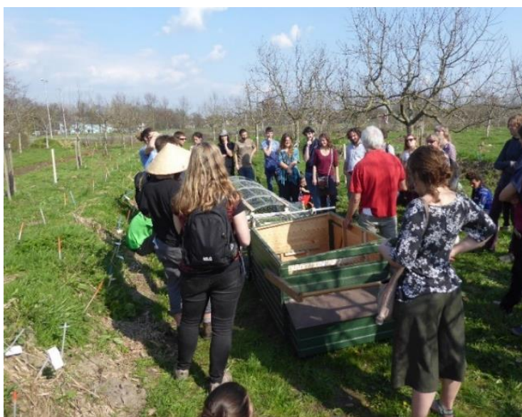
links de hügél, rechts de kippen tractor