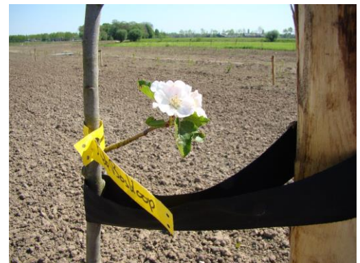
De Rode van Boskoop is van start gegaan

Onze hulptroepen duiken op! Hup zuring, maak de klei los met je diepe wortels.