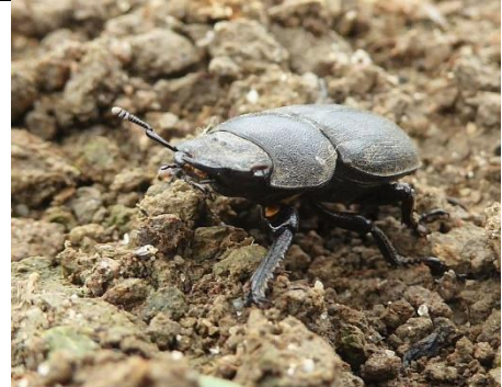
klein vliegend hert, duikt zomaar op